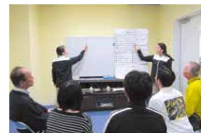
●リハビリプログラムの様子