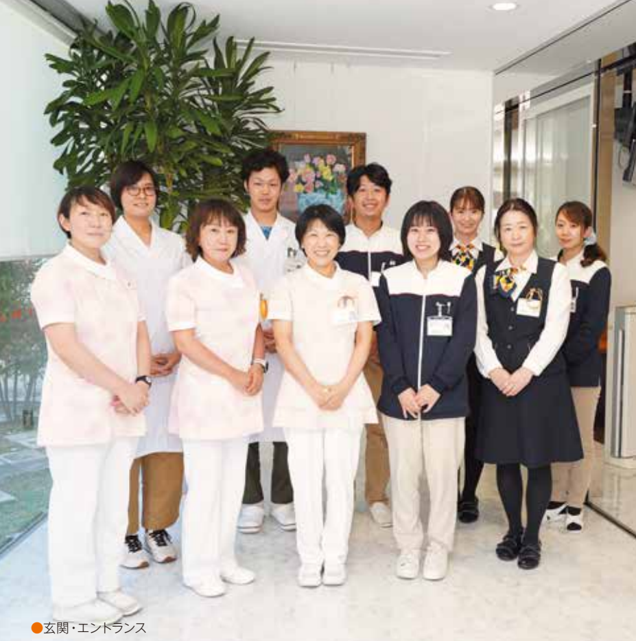
●玄関・エントランス