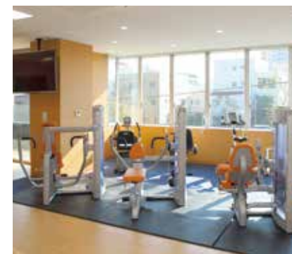
●トレーニングスペース